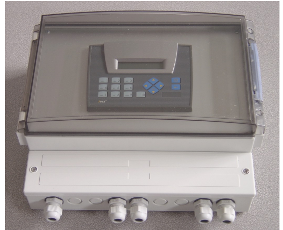
Centrale Autoscan JAZZ

L'Affichage de 2 lignes 20 caractères permet la visualisation les valeurs mesurées