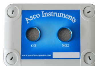
Capteurs Twin P